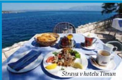
Strava v hotelu Timun