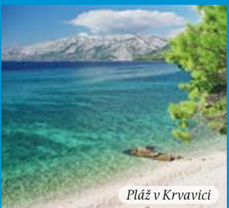
Pláž v Krvavici