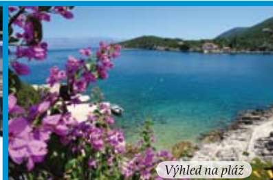
Výhled na pláž

Pokrivenik leží na severní straně ostrova Hvar, asi 35 km od mysu a trajektového přístavu Sućuraj a 45 km od města Stari Grad. Okouzlí neuvěřitelně průzračným mořem, čistým vzduchem, vytesanými skálami, nádhernou vůní středomořské vegetace a naprosto nedotčenou přírodou. Je jedním z nejkrásnějších zálivů ostrova. Vhodné pro milovníky klidné dovolené, motorových člunů či kanoí.