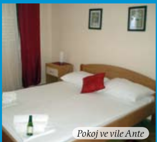
Pokoje ve vile Ante