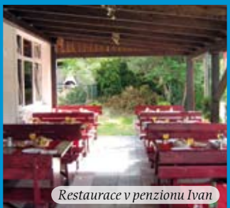
Restaurace v penzionu Ivan