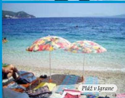
Pláž v Igrane

Letovisko Igrane se nachází 18 km jižně od města Makarska a je ideálním místem pro návštěvníky všech věkových kategorií, včetně rodin s dětmi. Zapůsobí na vás klidem, pohodou a srdečností místních obyvatel. Kromě městské pláže s bělostně jemnými obláčky se zde nachází i odlehlejší přírodní pláže se spoustou malebných zákoutí. Příjemnou procházkou spleť uličkami se lze dostat na nábřeží s romantickou promenádou, podél které jsou rozestaty útulné hospůdky, bary, předzahrádky a cukrárny. Dominantou městečka je starobylá zvonice kostela, od které je krásný výhled na městečko Igrane, Živogošće. Kouzelnou atmosféru vytváří scenérie horského masivu – pohoří Biokovo, které se tyčí nad letoviskem. Ideální poloha přímo vybízí k uskutečnění řady výletů do okolí, na ostrov Hvar a Korčula, do Dubrovniku, Makarské, Medjugorje, Mostaru, do národního parku Biokovo, na rafting na řece Cetině a další.