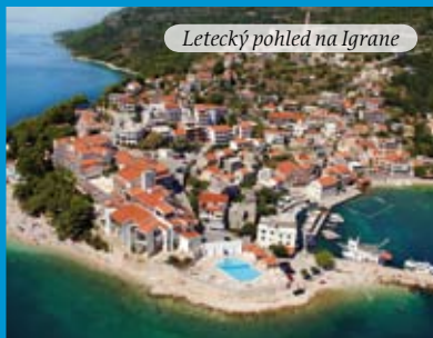
Letecký pohled na Igrane