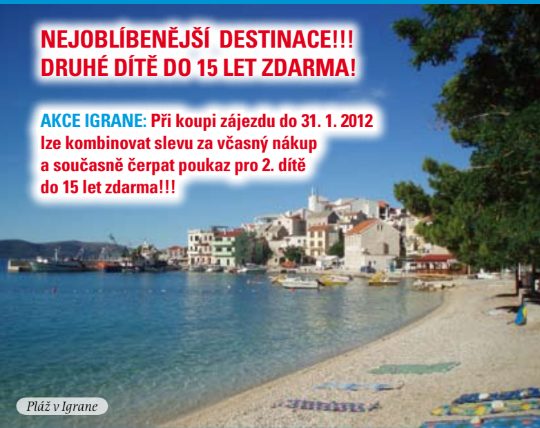
Pláž v Igrane

AKCE IGRANE: Při koupi zájezdu do 31. 1. 2012 lze kombinovat slevu za včasný nákup a současně čerpat poukaz pro 2. dítě do 15 let zdarma!!!