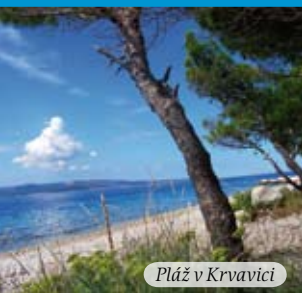
Pláž v Krvavici