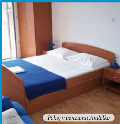
Pokoj v penzionu Andělko