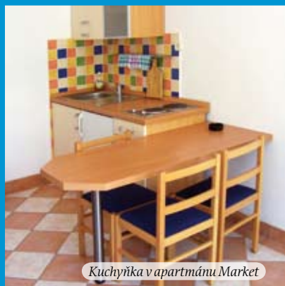
Kuchyňka v apartmánu Market